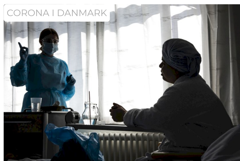
Regeringen og partierne enige: Sådan skal risikogrupper hjælpes

Tilmeld dig nyhedsbrevet fra A4 Arbejds miljø her