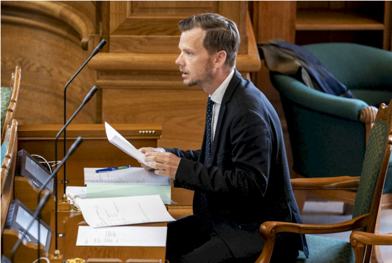
Det er forventningen, at beskæftigelsesministeren præsenterer en løsningsmodel for risikogrupper på et møde onsdag.